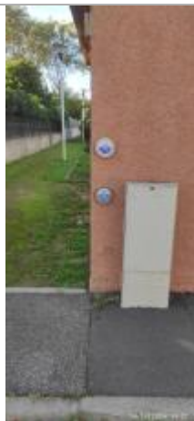
vue des repères

Altitude calculée de l'eau (en m) : 5.48 m