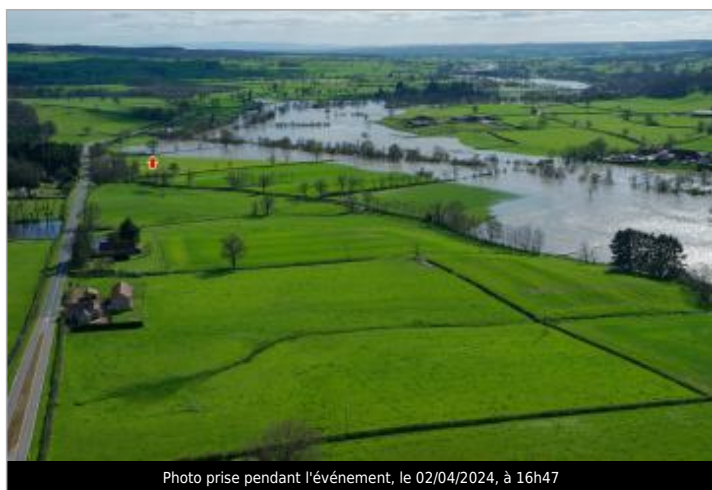
Photo prise pendant l'événement, le 02/04/2024, à 16h47

SOURCE DE REPÉRAGE : SPC LACI, PVA DRONE, L'ARROUX, AVRIL 2024 - 12/08/2024