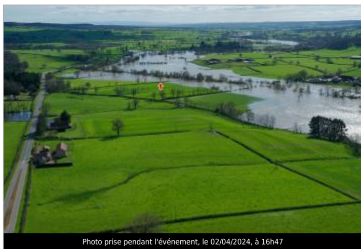
Photo prise pendant l'événement, le 02/04/2024, à 16h47