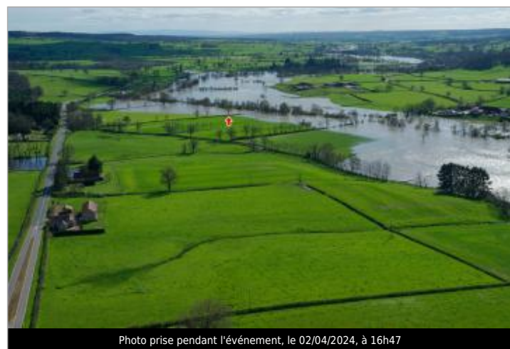
Photo prise pendant l'événement, le 02/04/2024, à 16h47