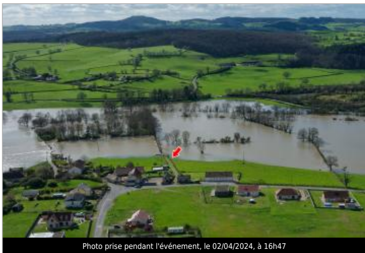
Photo prise pendant l'événement, le 02/04/2024, à 16h47