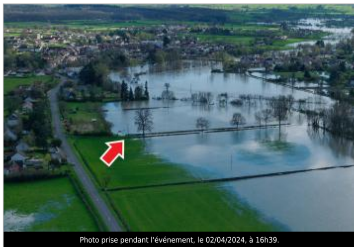
Photo prise pendant l'événement, le 02/04/2024, à 16h39.