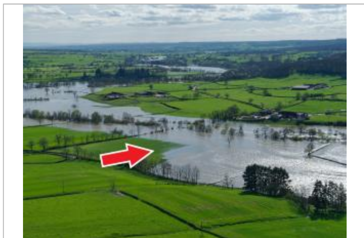
Photo prise pendant l'événement, le 02/04/2024, à 16h47.

Altitude calculée de l'eau (en m) : 251.4 m