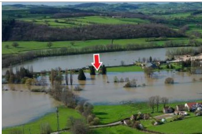
Photo prise pendant l'événement, le 02/04/2024, à 16h47.

Altitude calculée de l'eau (en m) : 252.2 m