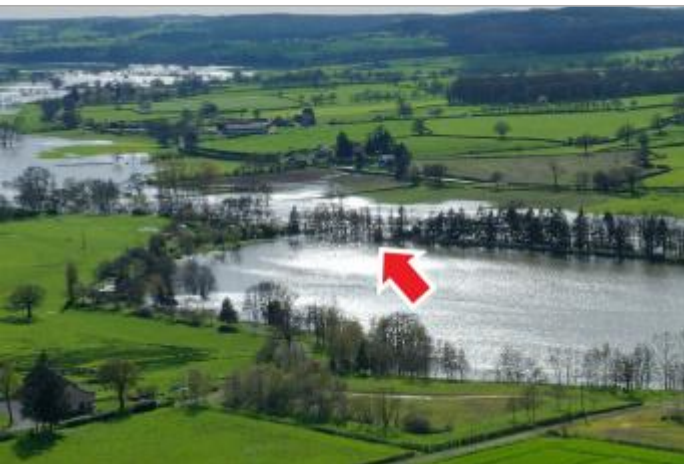
Photo prise pendant l'événement, le 02/04/2024, à 16h59.