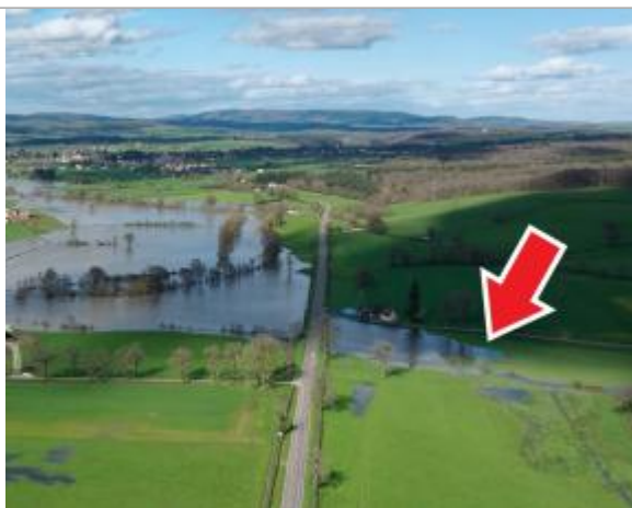
Photo prise pendant l'événement, le 02/04/2024, à 16h58.

Altitude calculée de l'eau (en m) : 250.6 m