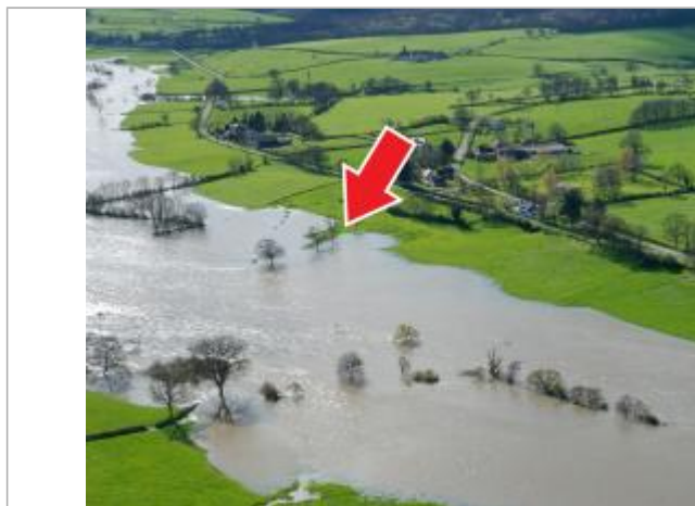
Photo prise pendant l'événement, le 02/04/2024, à 17h04.