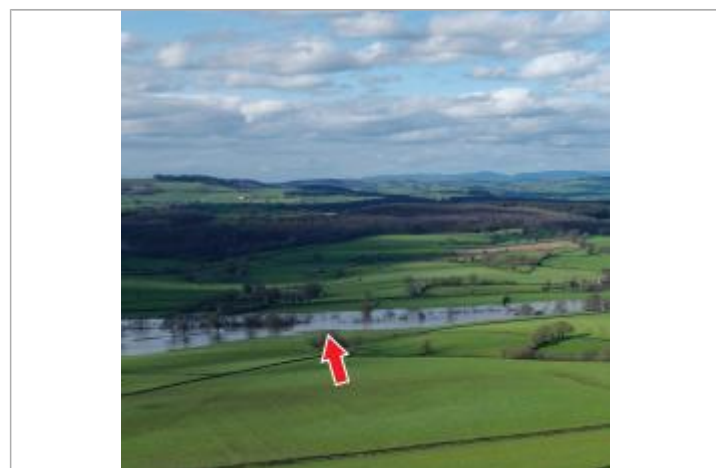
Photo prise pendant l'événement, le 02/04/2024, à 17h06.