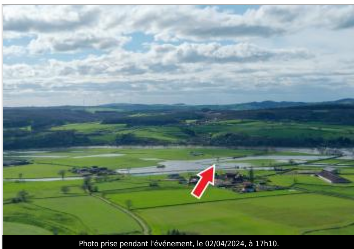
Photo prise pendant l'événement, le 02/04/2024, à 17h10.