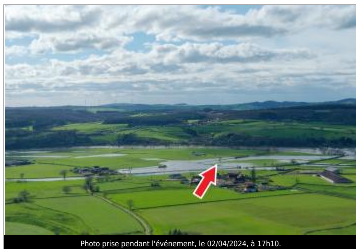
Photo prise pendant l'événement, le 02/04/2024, à 17h10.