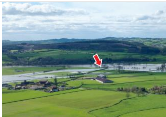
Photo prise pendant l'événement, le 02/04/2024, à 17h10.

Altitude calculée de l'eau (en m) : 246.7 m