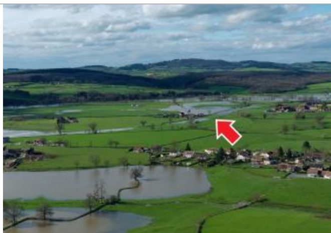
Photo prise pendant l'événement, le 02/04/2024, à 17h14.

Altitude calculée de l'eau (en m) : 245.6 m