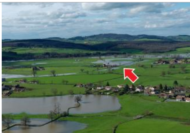
Photo prise pendant l'événement, le 02/04/2024, à 17h14.

Altitude calculée de l'eau (en m) : 245.6 m