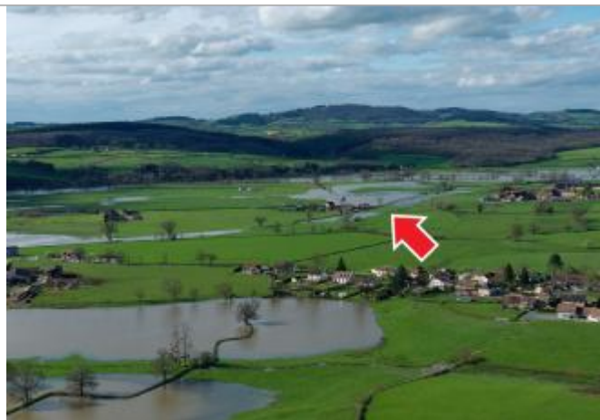
Photo prise pendant l'événement, le 02/04/2024, à 17h14.