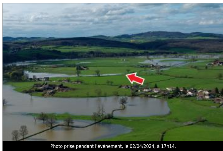
Photo prise pendant l'événement, le 02/04/2024, à 17h14.