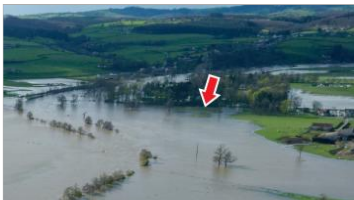
Photo prise pendant l'événement, le 02/04/2024, à 17h14.