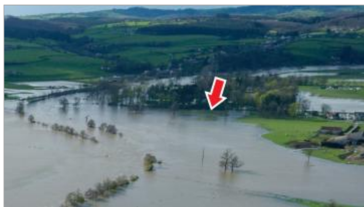
Photo prise pendant l'événement, le 02/04/2024, à 17h14.