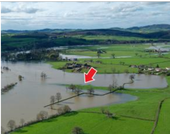
Photo prise pendant l'événement, le 02/04/2024, à 17h14.