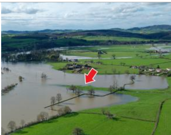
Photo prise pendant l'événement, le 02/04/2024, à 17h14.