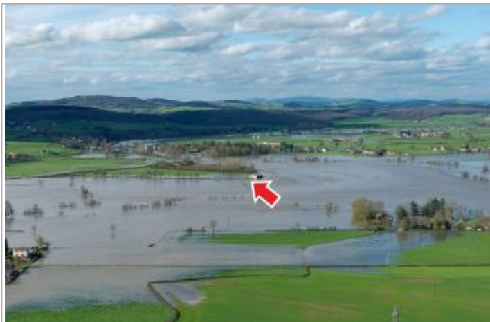
Photo prise pendant l'événement, le 02/04/2024, à 17h18.