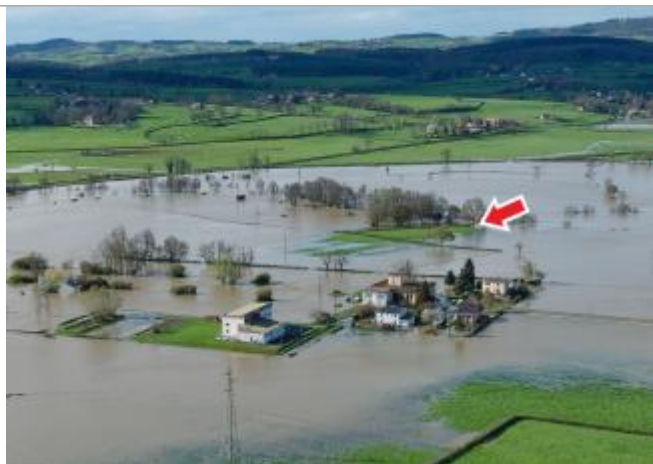
Photo prise pendant l'événement, le 02/04/2024, à 17h18.

Altitude calculée de l'eau (en m) : 243.8 m