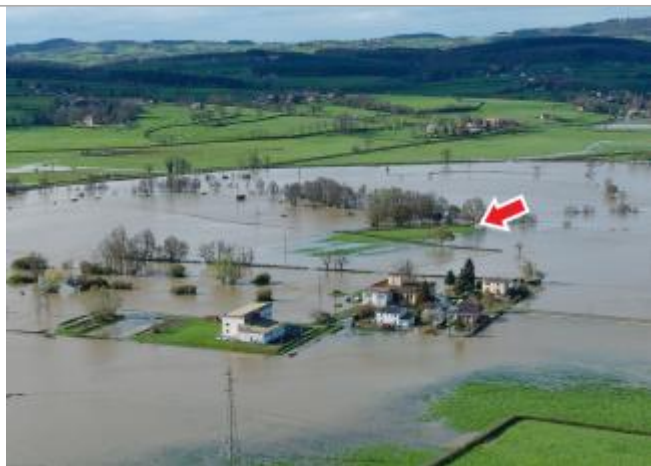
Photo prise pendant l'événement, le 02/04/2024, à 17h18.