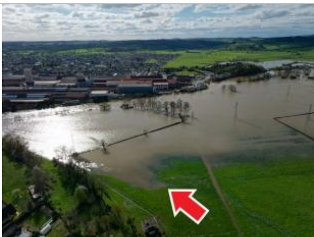
Photo prise pendant l'événement, le 02/04/2024, à 17h19.

Altitude calculée de l'eau (en m) : 242.6 m