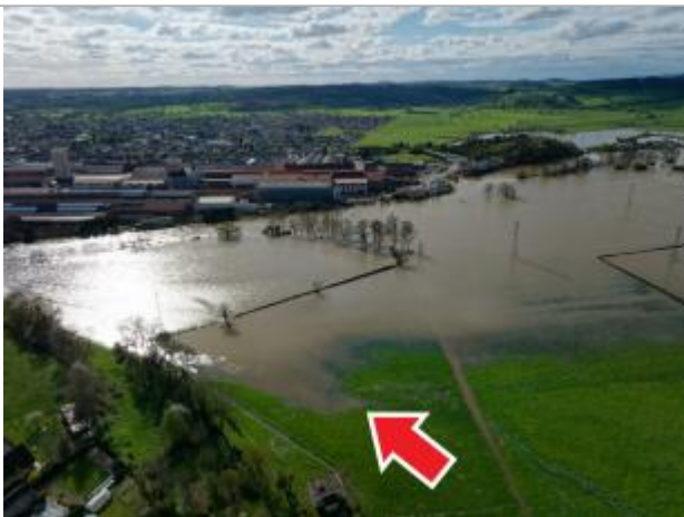
Photo prise pendant l'événement, le 02/04/2024, à 17h19.