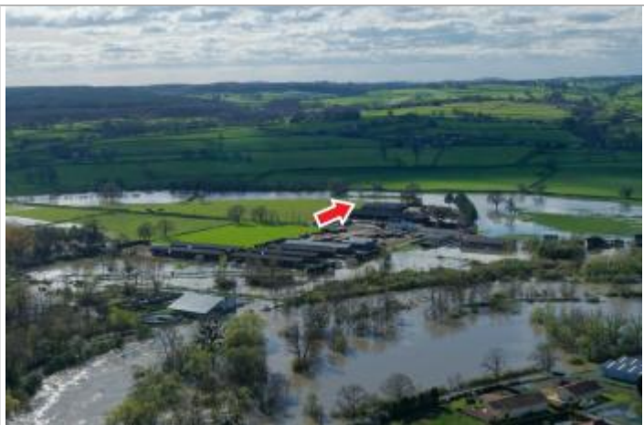
Photo prise pendant l'événement, le 02/04/2024, à 17h26.