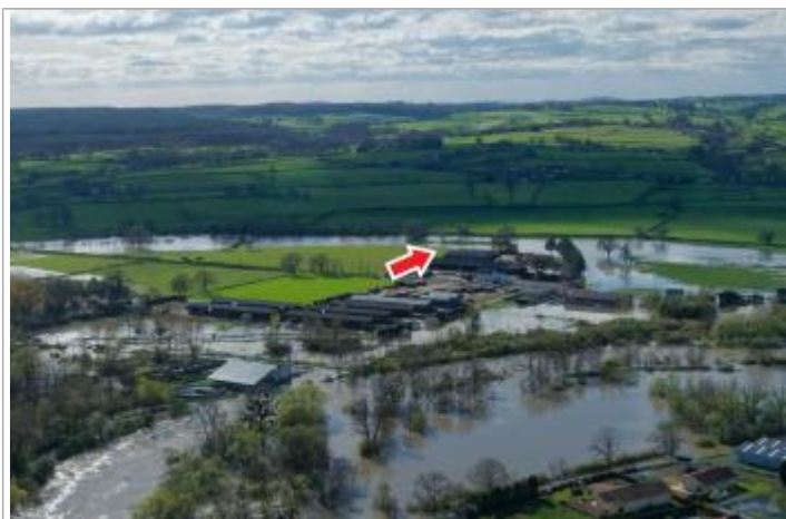
Photo prise pendant l'événement, le 02/04/2024, à 17h26.

Altitude calculée de l'eau (en m) : 239.5 m