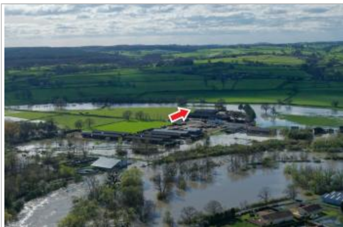
Photo prise pendant l'événement, le 02/04/2024, à 17h26.