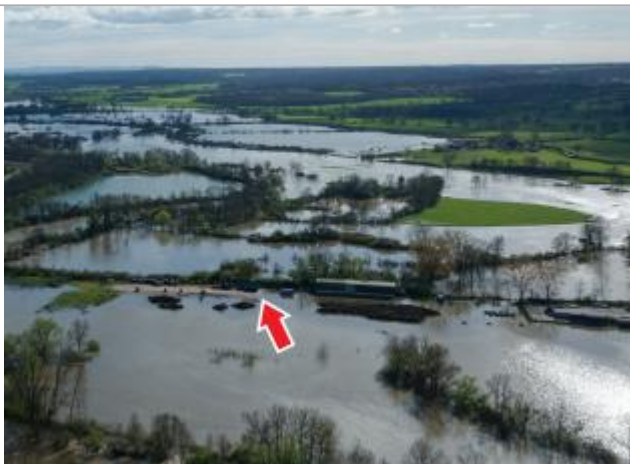
Photo prise pendant l'événement, le 02/04/2024, à 17h26.