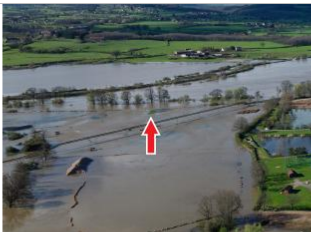
Photo prise pendant l'événement, le 02/04/2024, à 17h33.

Altitude calculée de l'eau (en m) : 238 m