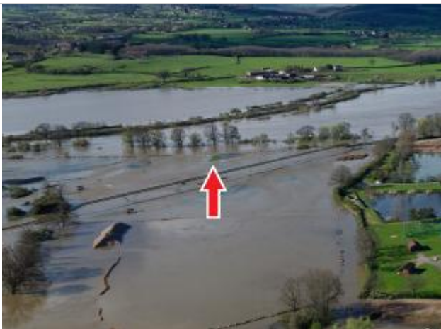
Photo prise pendant l'événement, le 02/04/2024, à 17h33.