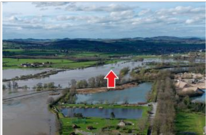
Photo prise pendant l'événement, le 02/04/2024, à 17h33.