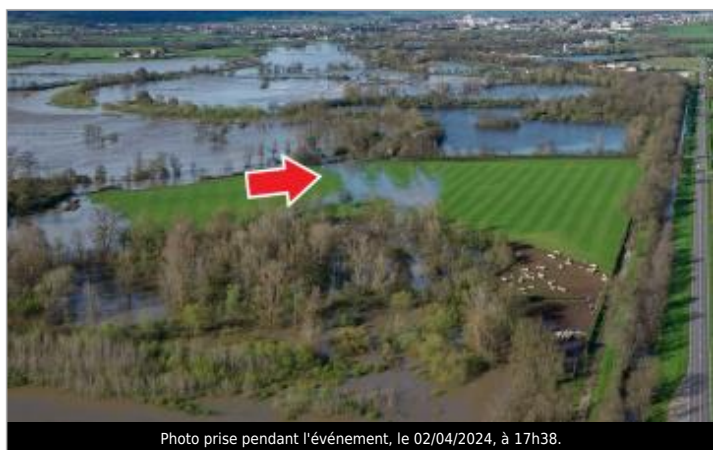
Photo prise pendant l'événement, le 02/04/2024, à 17h38.