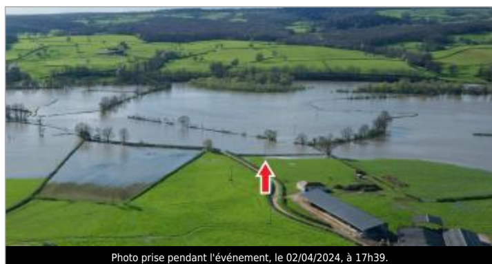
Photo prise pendant l'événement, le 02/04/2024, à 17h39.