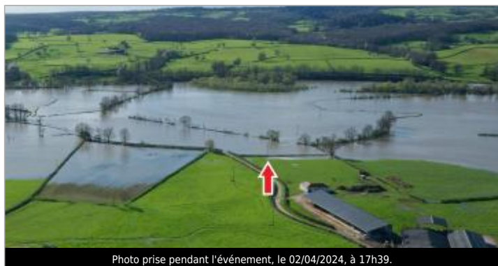
Photo prise pendant l'événement, le 02/04/2024, à 17h39.