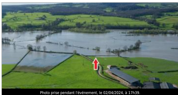
Photo prise pendant l'événement, le 02/04/2024, à 17h39.