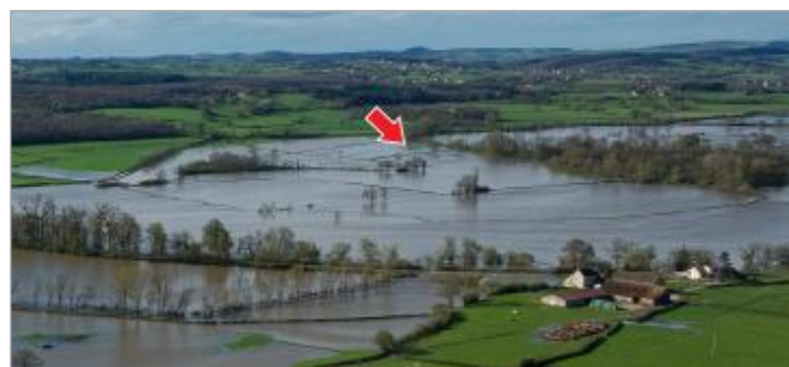
Photo prise pendant l'événement, le 02/04/2024, à 17h39.