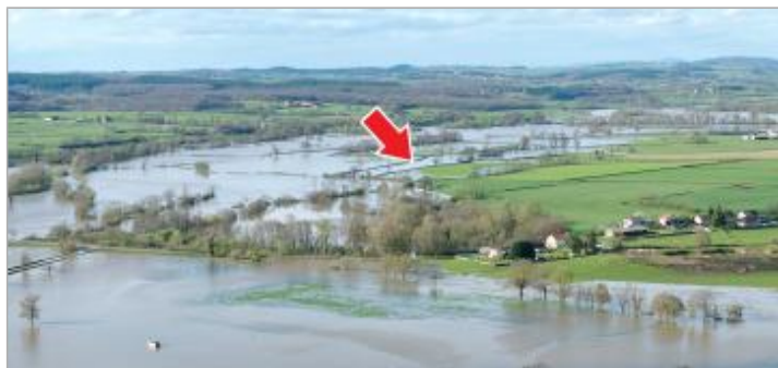
Photo prise pendant l'événement, le 02/04/2024, à 17h52.