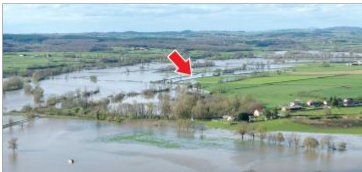
Photo prise pendant l'événement, le 02/04/2024, à 17h52.