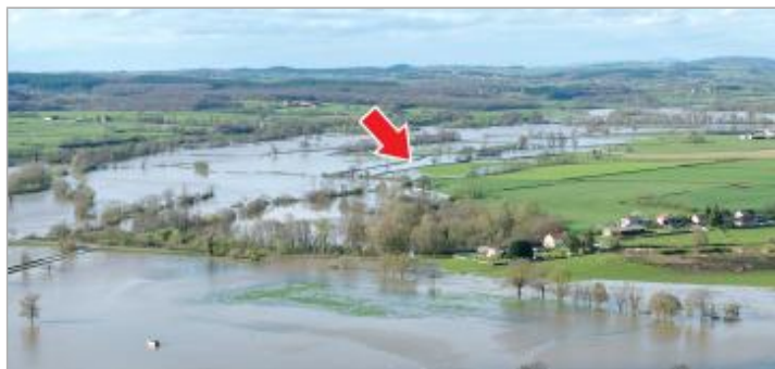
Photo prise pendant l'événement, le 02/04/2024, à 17h52.