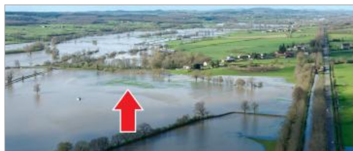
Photo prise pendant l'événement, le 02/04/2024, à 17h52.