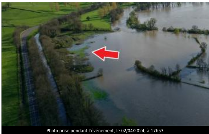
Photo prise pendant l'événement, le 02/04/2024, à 17h53.