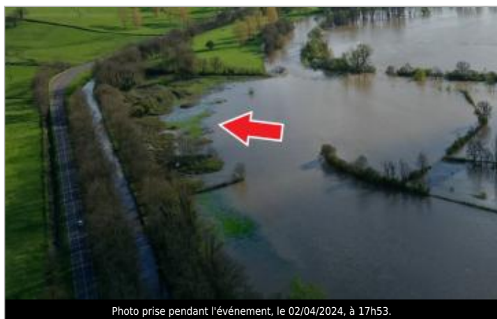
Photo prise pendant l'événement, le 02/04/2024, à 17h53.