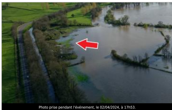
Photo prise pendant l'événement, le 02/04/2024, à 17h53.