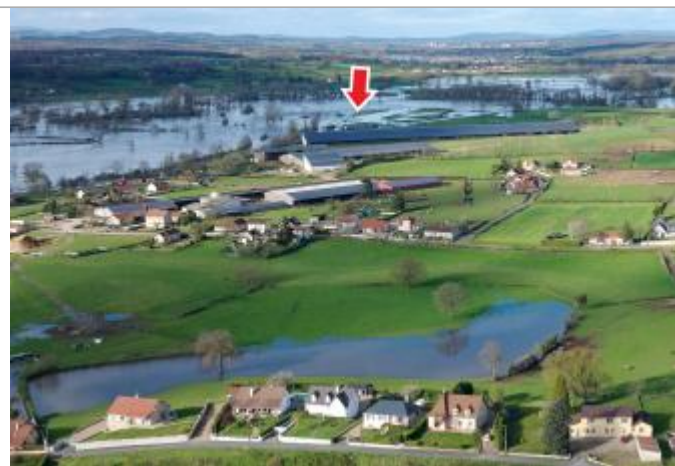
Photo prise pendant l'événement, le 02/04/2024, à 18h05.