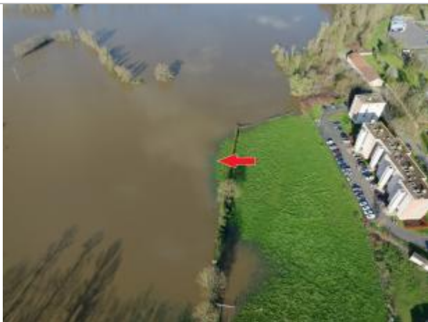
Photo prise pendant l'événement, le 02/04/2024, à 18h23.