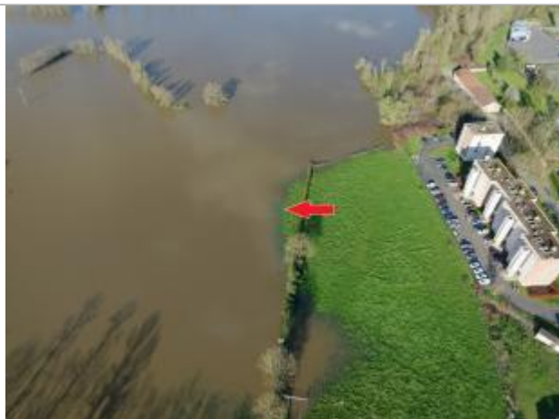
Photo prise pendant l'événement, le 02/04/2024, à 18h23.

Altitude calculée de l'eau (en m) : 227.2 m