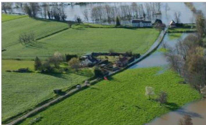
Photo prise pendant l'événement, le 02/04/2024, à 18h24.