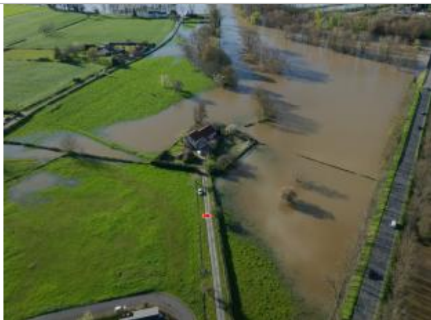
Photo prise pendant l'événement, le 02/04/2024, à 18h24.