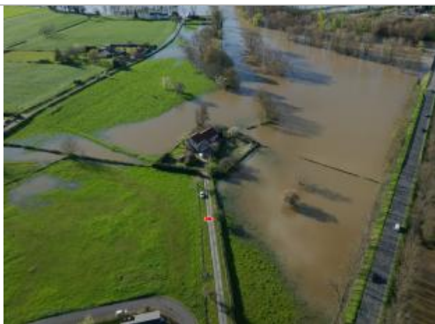
Photo prise pendant l'événement, le 02/04/2024, à 18h24.