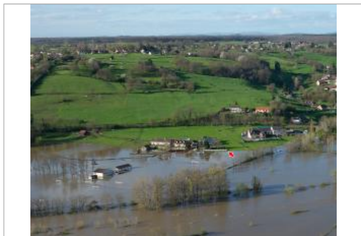
Photo prise pendant l'événement, le 02/04/2024, à 18h23.