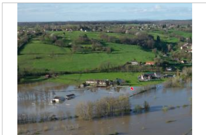
Photo prise pendant l'événement, le 02/04/2024, à 18h23.

Code : 24LACIAX1_R_21_1 Date de mise à jour : 21/11/2024 Auteur : SPC LACI