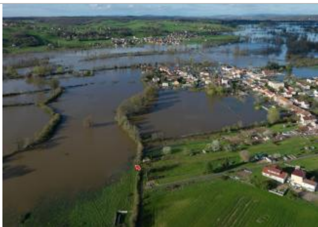
Photo prise pendant l'événement, le 02/04/2024, à 18h15.

Altitude calculée de l'eau (en m) : 227.5 m