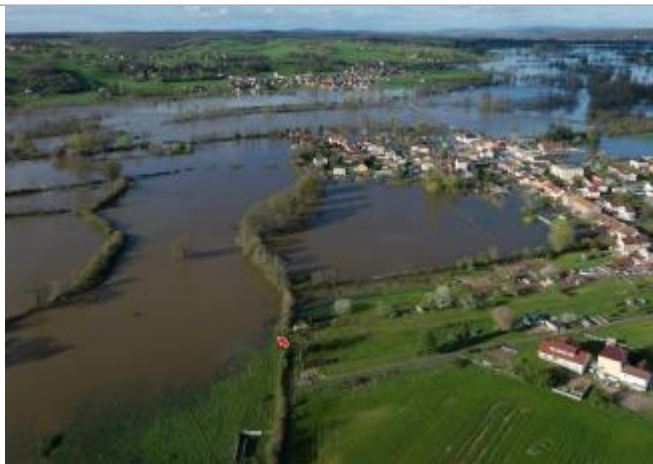
Photo prise pendant l'événement, le 02/04/2024, à 18h15.