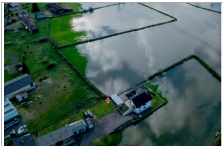
Photo prise pendant l'événement, le 02/04/2024, à 18h06.