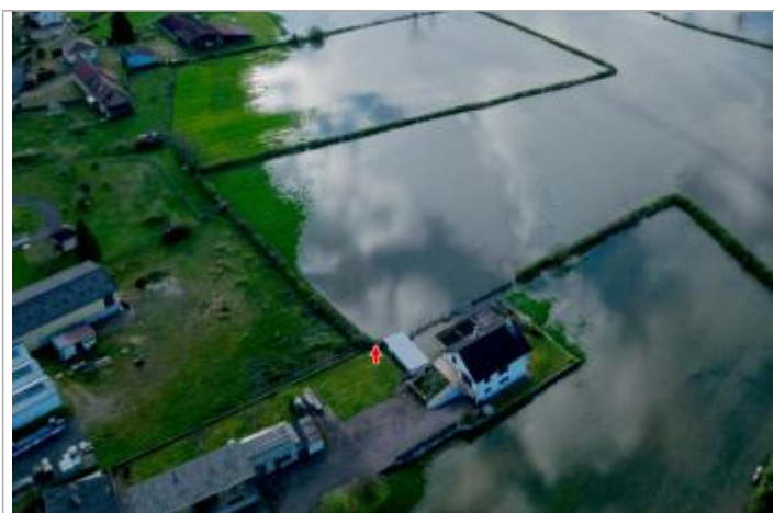
Photo prise pendant l'événement, le 02/04/2024, à 18h06.