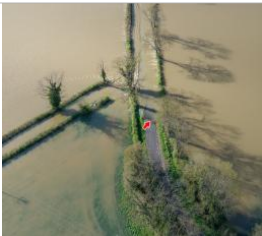
Photo prise pendant l'événement, le 02/04/2024, à 17h52.