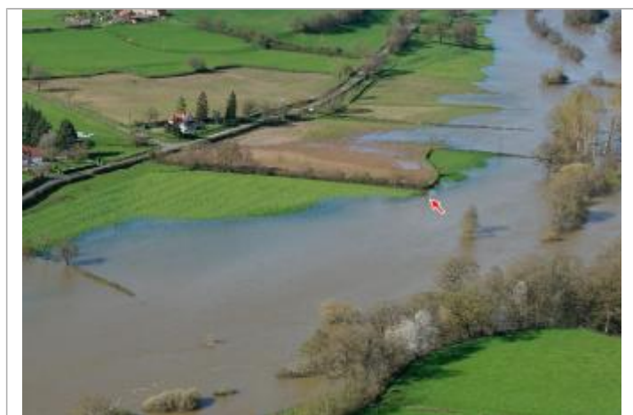
Photo prise pendant l'événement, le 02/04/2024, à 17h04.