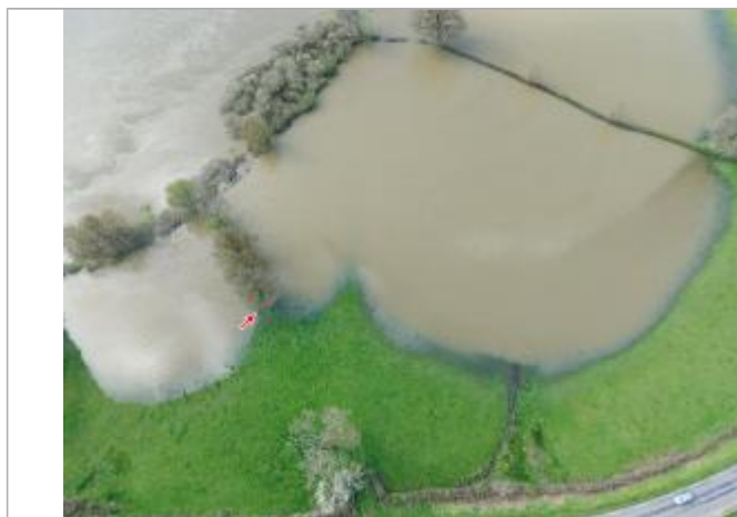
Photo prise pendant l'événement, le 02/04/2024, à 16h53.