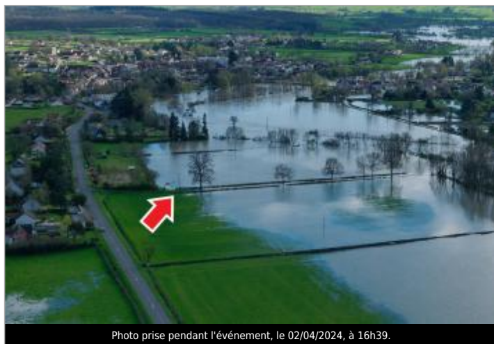
Photo prise pendant l'événement, le 02/04/2024, à 16h39.