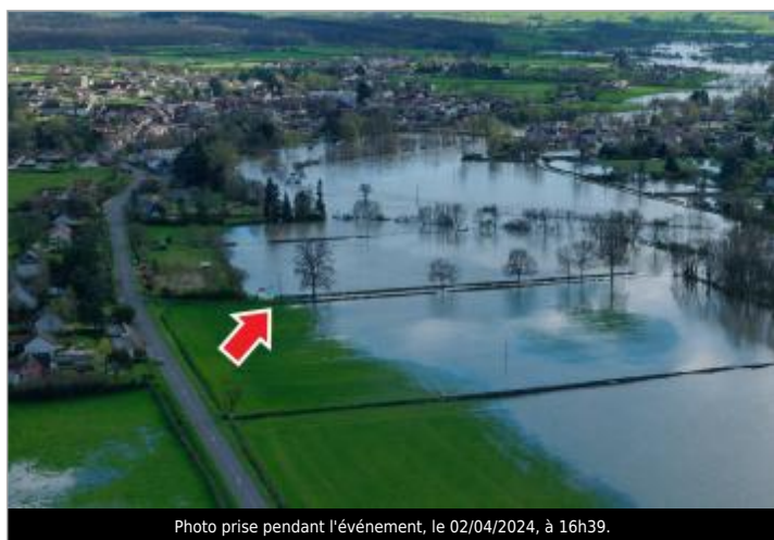
Photo prise pendant l'événement, le 02/04/2024, à 16h39.