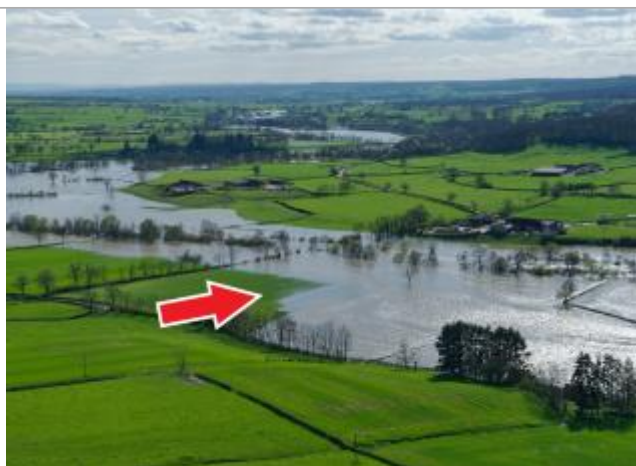
Photo prise pendant l'événement, le 02/04/2024, à 16h47.

Altitude calculée de l'eau (en m) : 251.4