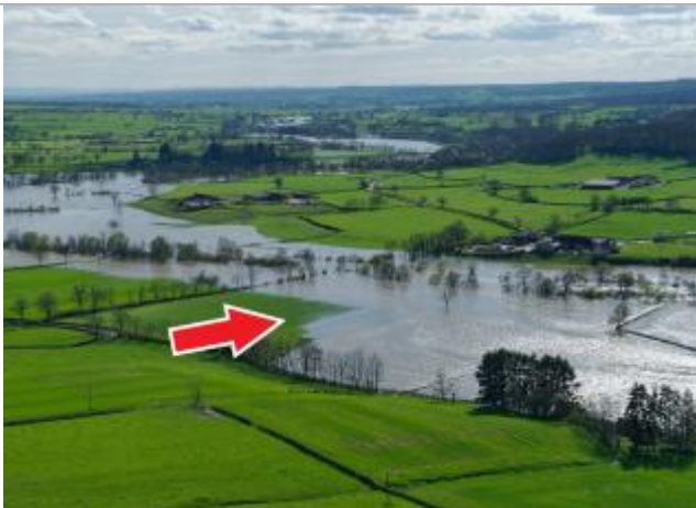
Photo prise pendant l'événement, le 02/04/2024, à 16h47.