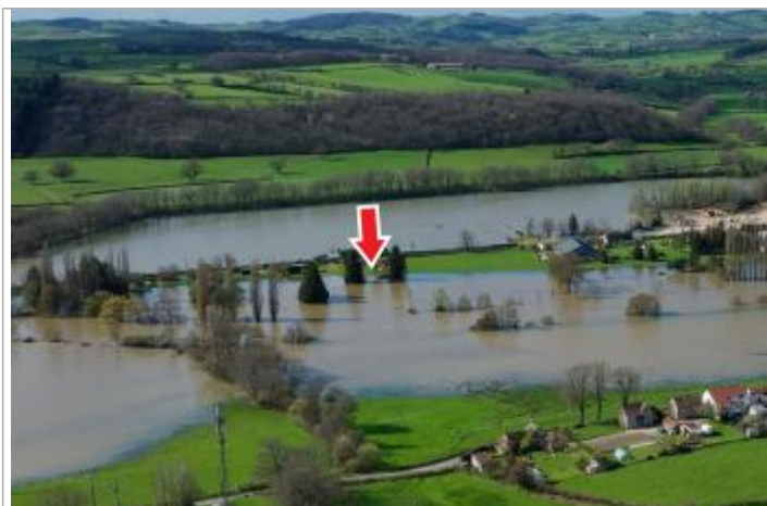
Photo prise pendant l'événement, le 02/04/2024, à 16h47.