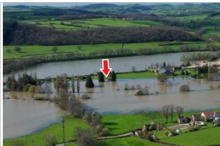
Photo prise pendant l'événement, le 02/04/2024, à 16h47.