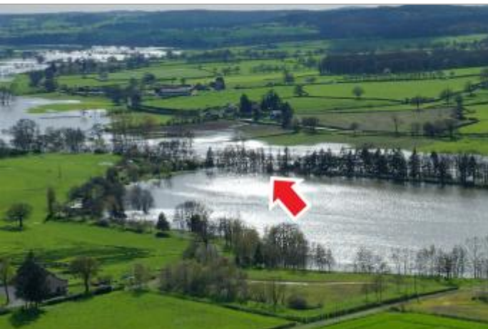
Photo prise pendant l'événement, le 02/04/2024, à 16h59.