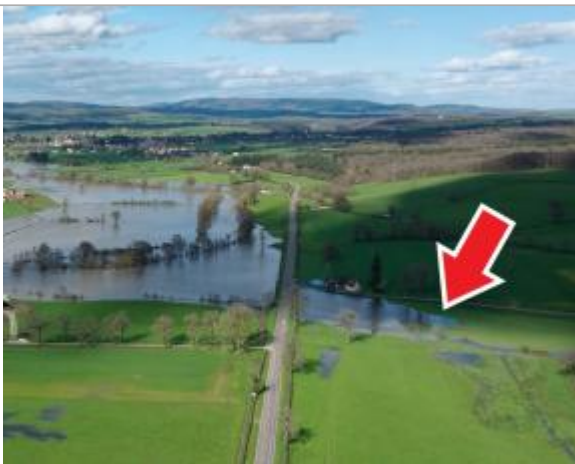
Photo prise pendant l'événement, le 02/04/2024, à 16h58.