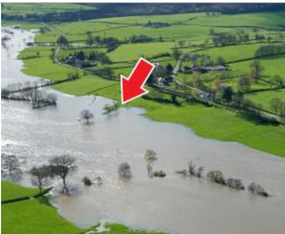
Photo prise pendant l'événement, le 02/04/2024, à 17h04.