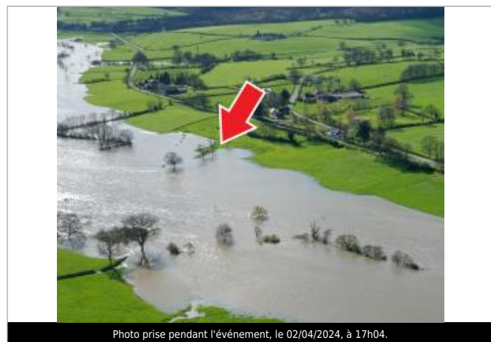
Photo prise pendant l'événement, le 02/04/2024, à 17h04.