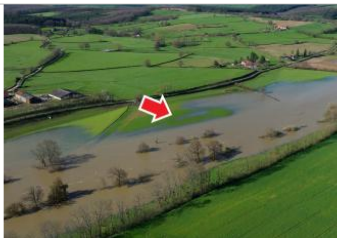
Photo prise pendant l'événement, le 02/04/2024, à 17h04.

Altitude calculée de l'eau (en m) : 248.35