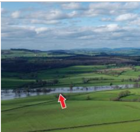
Photo prise pendant l'événement, le 02/04/2024, à 17h06.