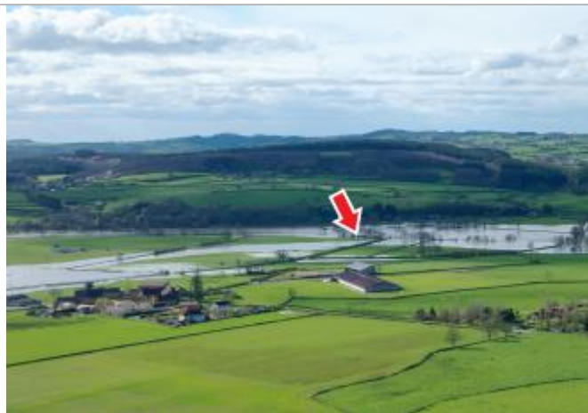
Photo prise pendant l'événement, le 02/04/2024, à 17h10.