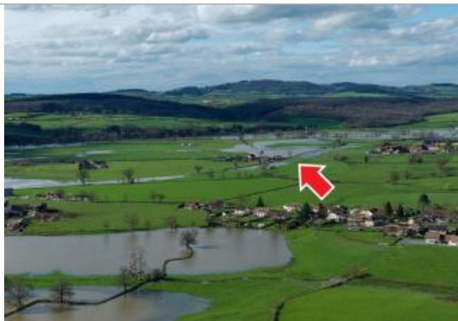
Photo prise pendant l'événement, le 02/04/2024, à 17h14.

Altitude calculée de l'eau (en m) : 245.6